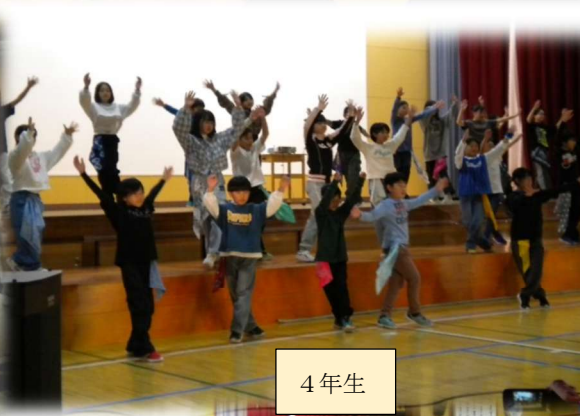
4 年 生