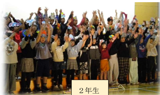
2 年 生