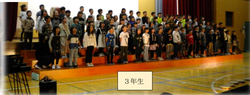
3 年 生