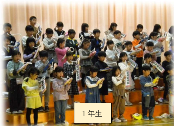
1 年 生

来賓の方からも「感動しました」とお褒めの言葉もいただきました。私も子どもたちの発表、そして成長に改めて感動したところでした。