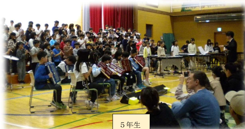
5 年 生